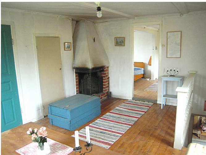
Möblerbar trapphall med öppen spis.