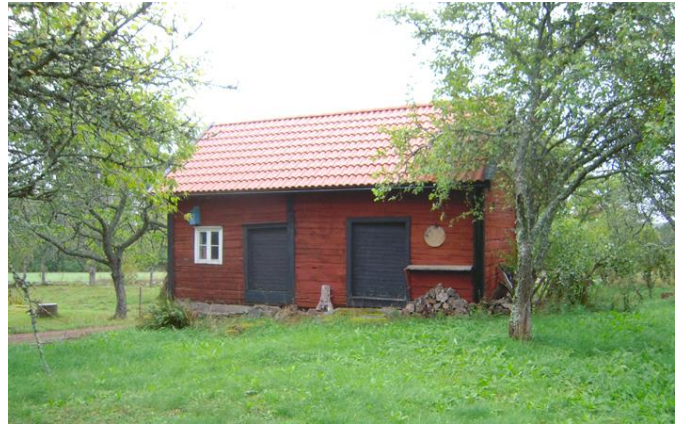
Timrad bod, tegeltak från 2013. Används till förvaringsutrymmen.