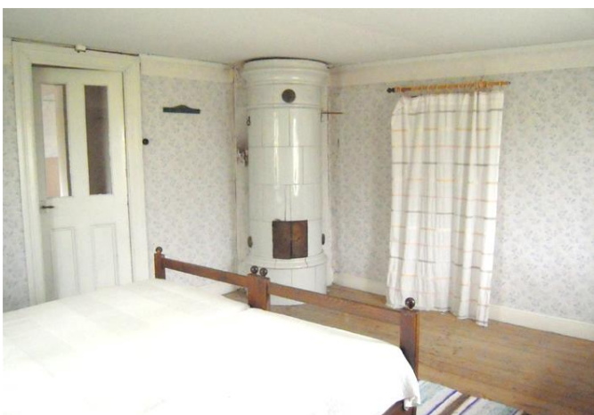
Två sovrum uppe. Skorstenen till kakelugnen är nedplockad till undernock.