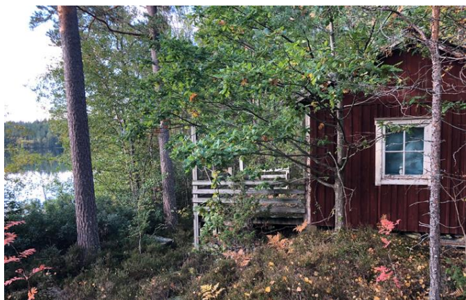
Enklare stuga vid Skatsjön.