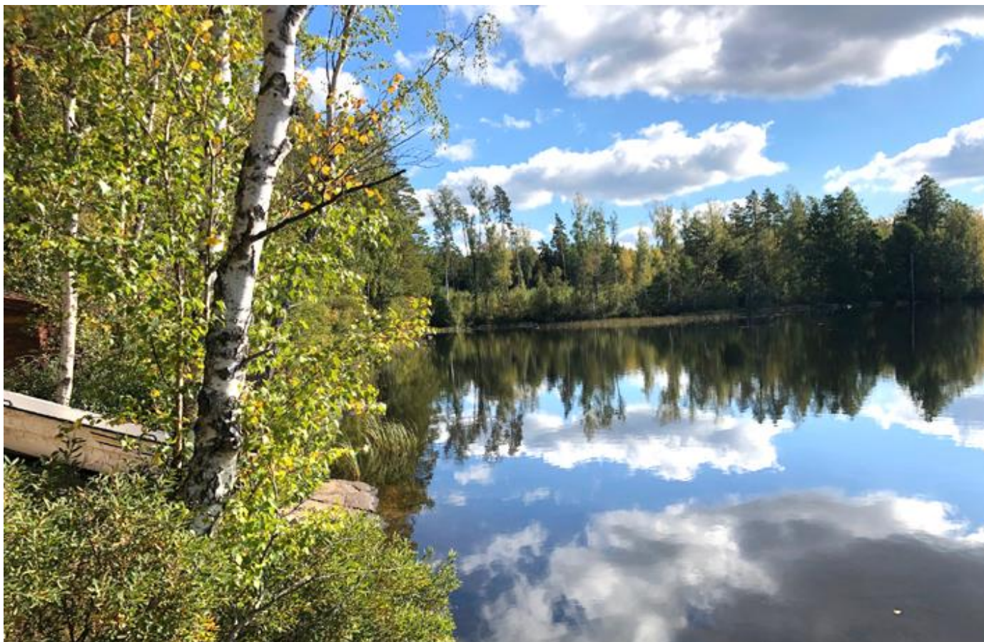
Fiskerätt i Skatsjön med bl.a kräftfiske