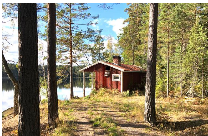
"Adolfsons stuga", byggnad vid Skatsjön på ofri grund där ägarna ej varit på länge.

Ytterligare finns det en scoutstuga på ofri grund i anslutning till Vena samhälle.